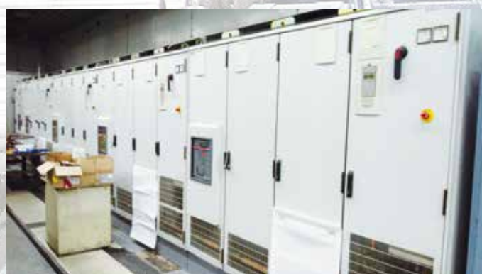
Nova SMS elektro oprema montirana u Elektro stanici V-2