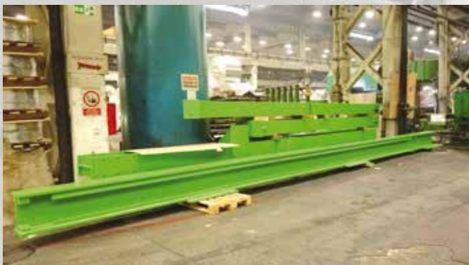
Deo čelice konst. koju je izradila TEHNIKA d.o.o. čeka na montažu