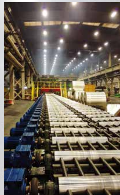
Zamenjeni elektro motori na izlaznom rolgangu V-2

U toku su intenzivne aktivnosti sa više dobavljača („VIG“-Turska, „PARKEGATE“-Engleska i „ACHENBACH“-Ne- mačka) radi pribavljanja odgovarajućih ponuda i mogućih tehničkih rešenja u funkciji pripreme za realizaciju ovog podprojekta.