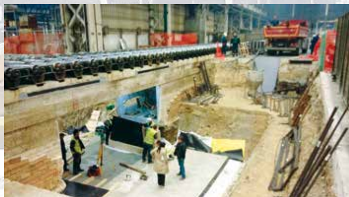
Izrada fundamenata za nove Giljotinske makaze