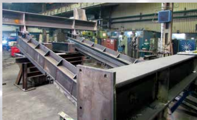
Izrada elemenata čelične konstrukcije V-2 u Mašinskoj radionici TEHNIKA d.o.o.