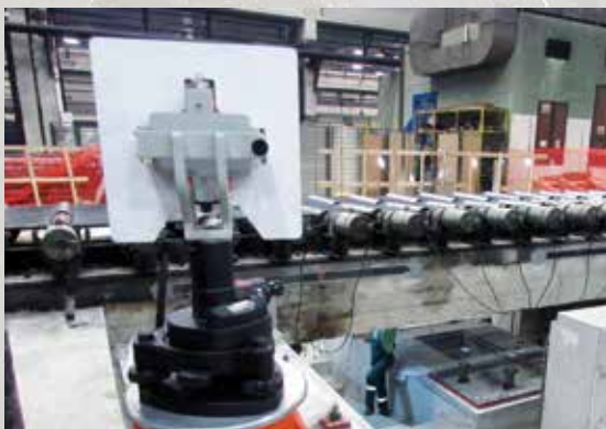
Završena izrada fundamenata za nove Giljotinske makaze