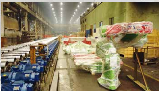
Deo mašinske opreme koju je isporučila PARKEGATE čeka na montažu